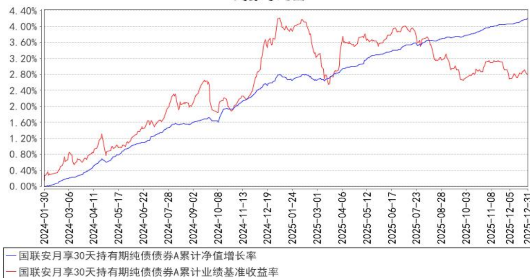
国联安月享30天持有期纯债债券A累计净值增长率与同期业绩比较基准收益率的历史走势对比图

注：1、本基金业绩比较基准为中债综合指数收益率*80%+一年期定期存款利率(税后)*20%； 2、本基金基金合同于 2024 年 1 月 30 日生效； 3、本基金建仓期为自基金合同生效之日起的 6 个月，建仓期结束时各项资产配置符合合同约定。