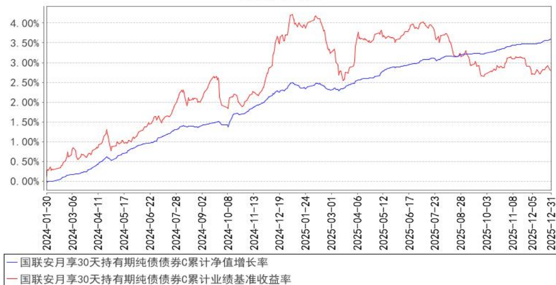
国联安月享30天持有期纯债债券C累计净值增长率与同期业绩比较基准收益率的历史走势对比图