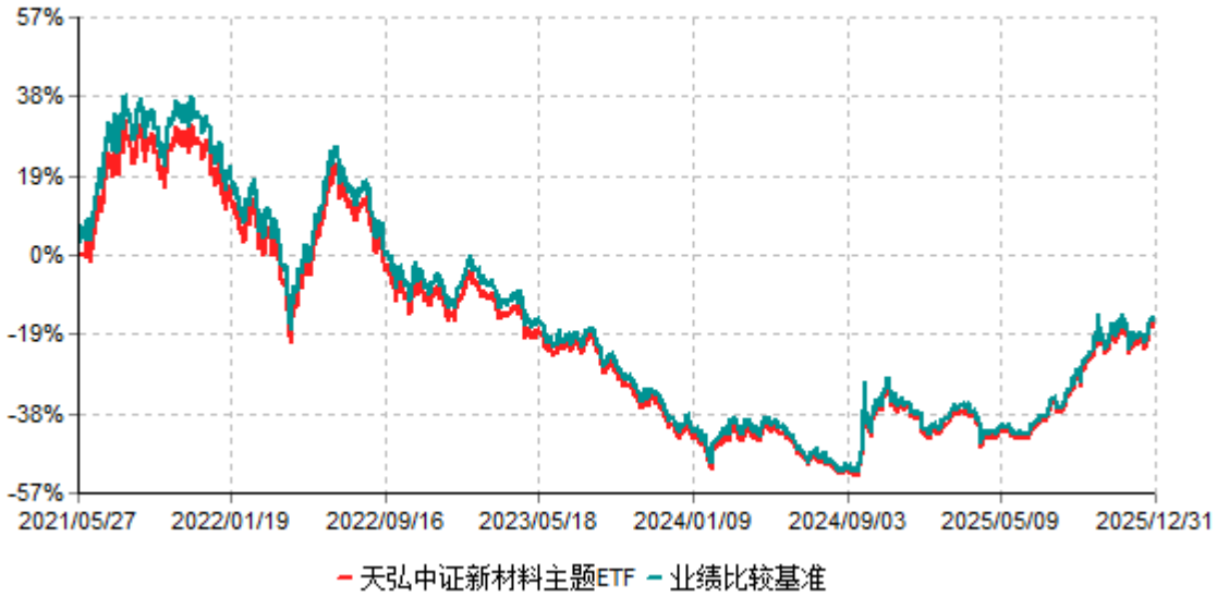
天弘中证新材料主题ETF累计净值增长率与业绩比较基准收益率历史走势对比图 (2021年05月27日-2025年12月31日)