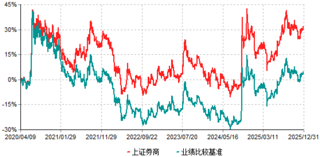
上证券商累计净值增长率与业绩比较基准收益率历史走势对比图 (2020年04月09日-2025年12月31日)