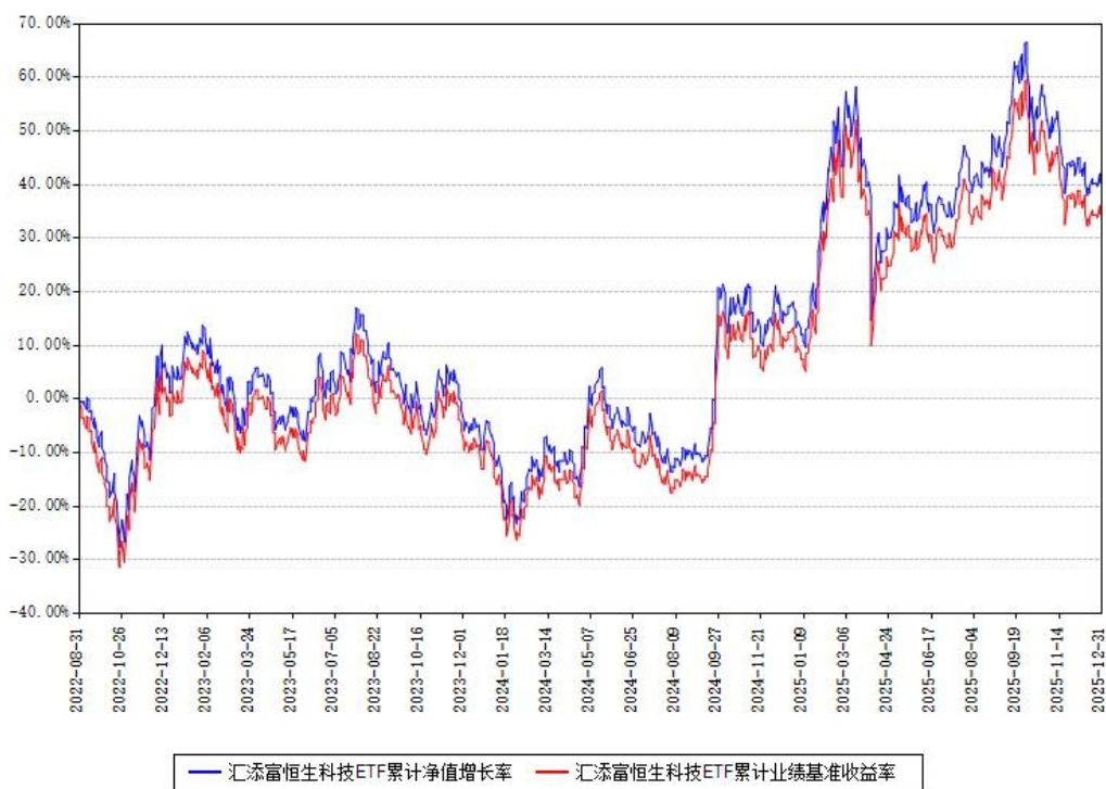
汇添富恒生科技ETF累计净值增长率与同期业绩基准收益率对比图

注：本基金建仓期为本《基金合同》生效之日（2022年08月31日）起6个月，建仓期结束时各项资产配置比例符合合同约定。