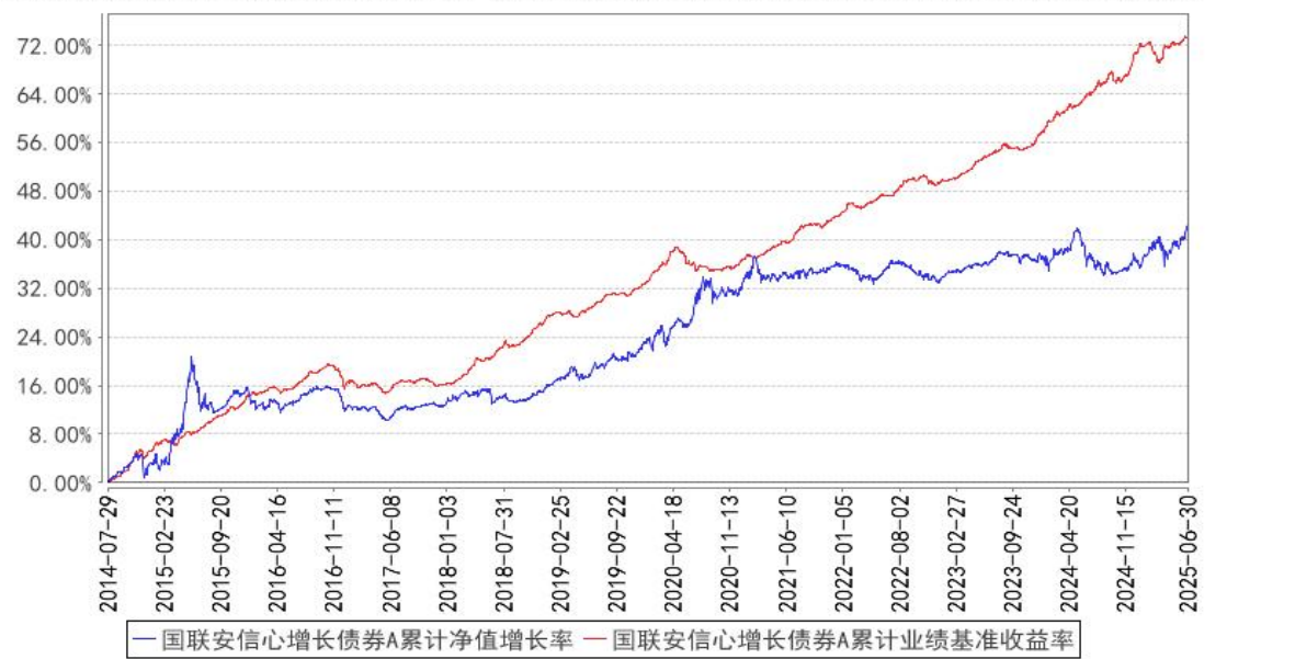
国联安信心增长债券A累计净值增长率与同期业绩比较基准收益率的历史走势对比图

注：1、本基金的业绩比较基准为中证全债指数； 2、本基金转型日期为 2014 年 7 月 29 日，本基金建仓期为自基金转型之日起的 6 个月，建仓期结束时各项资产配置符合合同约定。