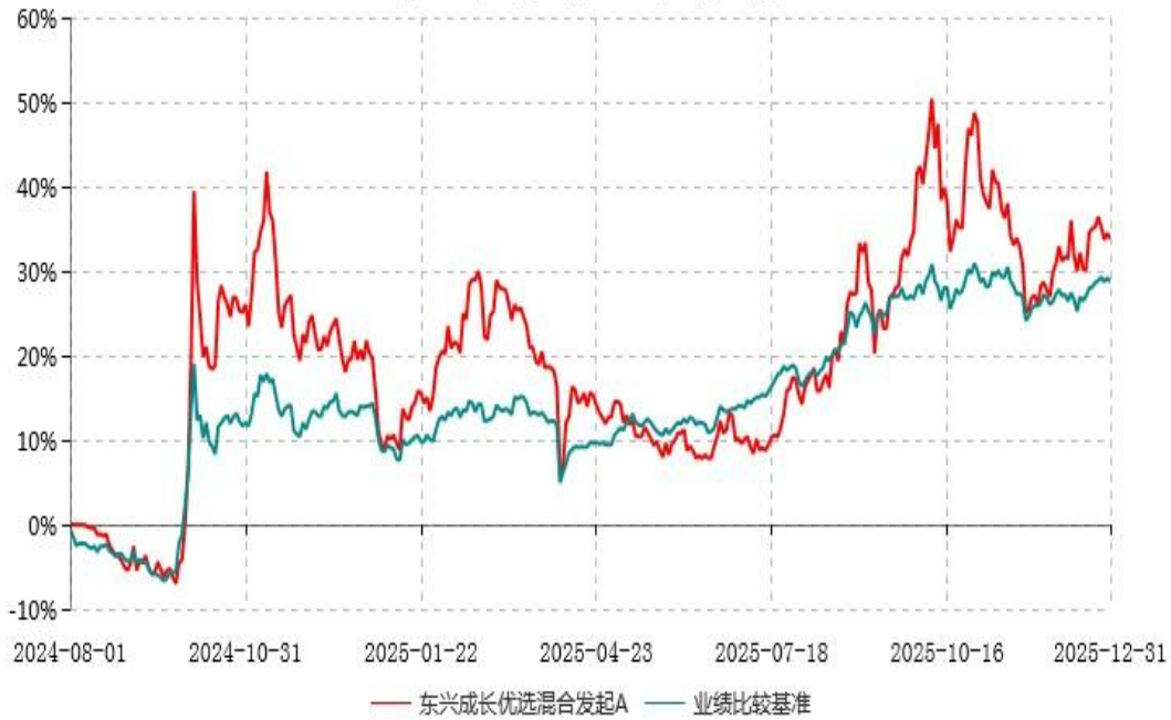
东兴成长优选混合发起A累计净值增长率与业绩比较基准收益率历史走势对比图 (2024年08月01日-2025年12月31日)