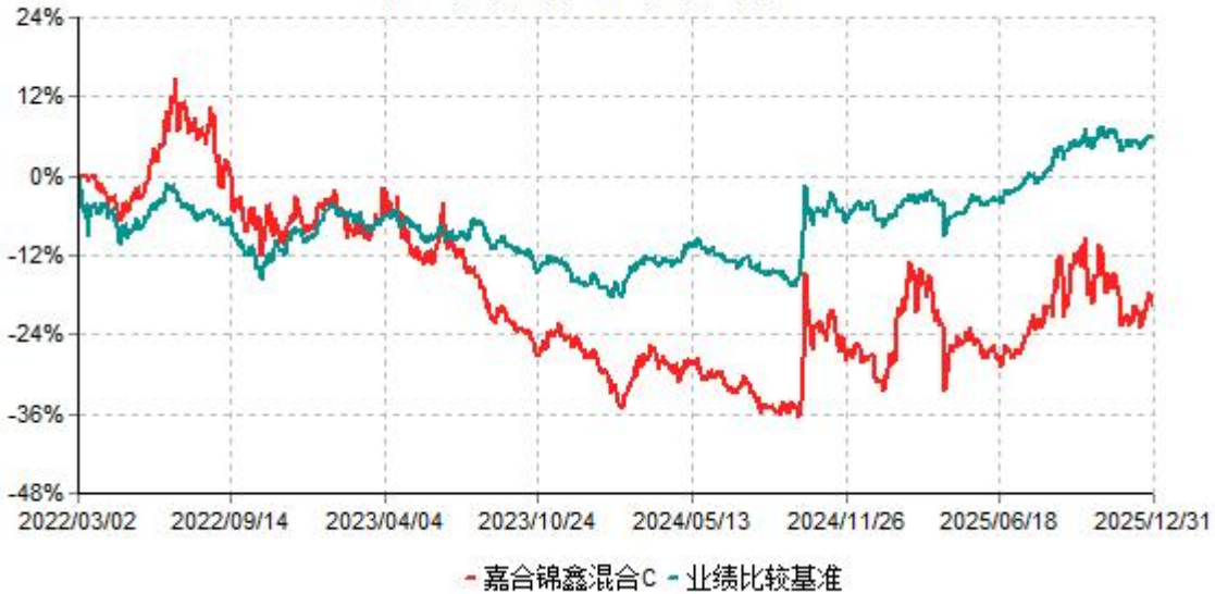
嘉合锦鑫混合C累计净值增长率与业绩比较基准收益率历史走势对比图 (2022年03月02日-2025年12月31日)