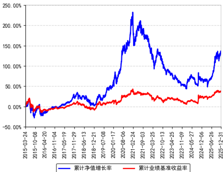
南方创新经济灵活配置混合累计净值增长率与同期业绩比较基准收益率的历史走势对比图