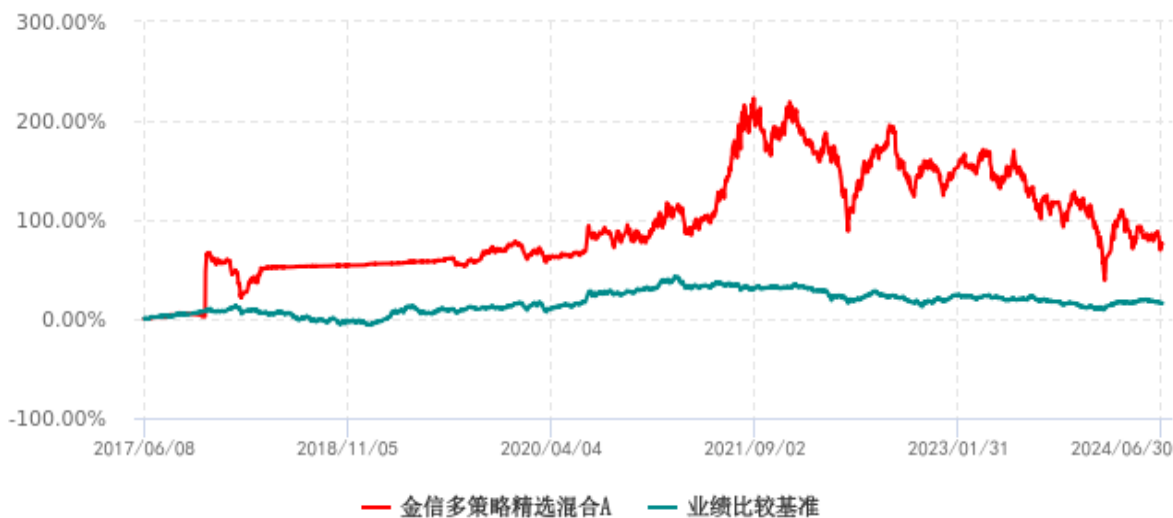
金信多策略精选混合A累计净值增长率与业绩比较基准收益率历史走势对比图 (2017年06月08日-2024年06月30日)