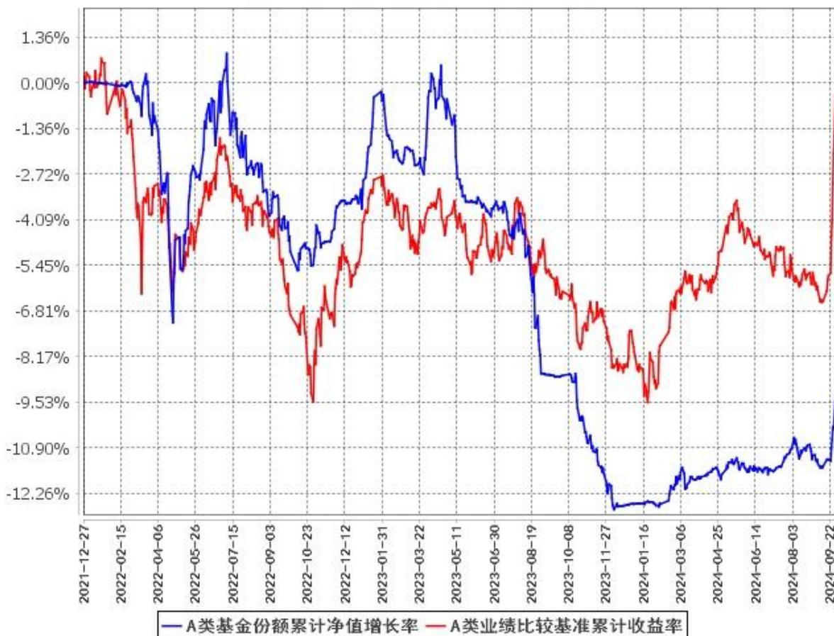
A类基金份额累计净值增长率与同期业绩比较基准收益率的历史走势对比图 (2021年12月27日至2024年9月30日)