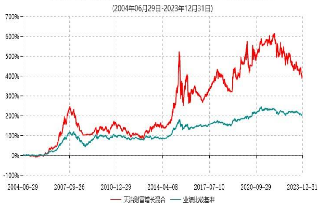
天治财富增长证券投资基金累计净值增长率与业绩比较基准收益率历史走势对比图