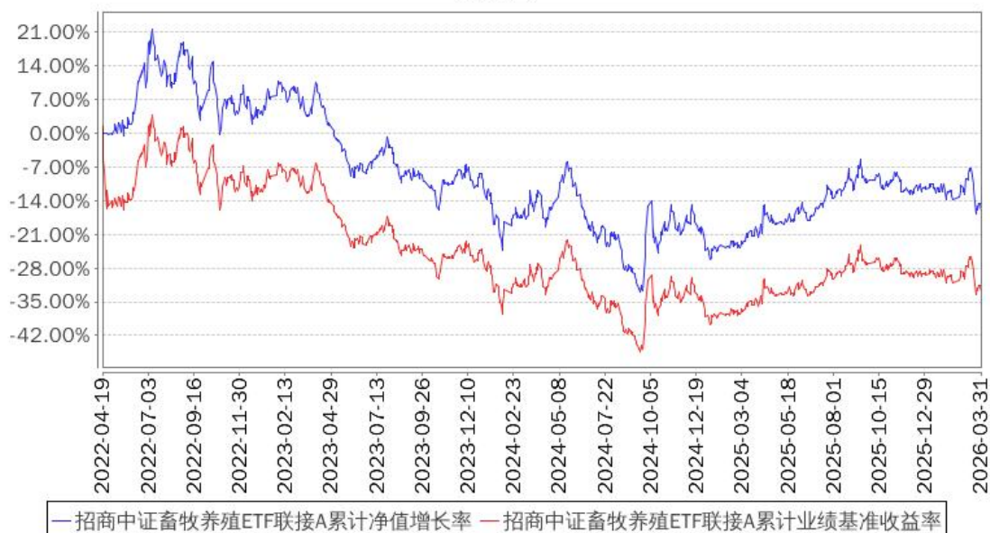
招商中证畜牧养殖ETF联接A累计净值增长率与同期业绩比较基准收益率的历史走势对比图