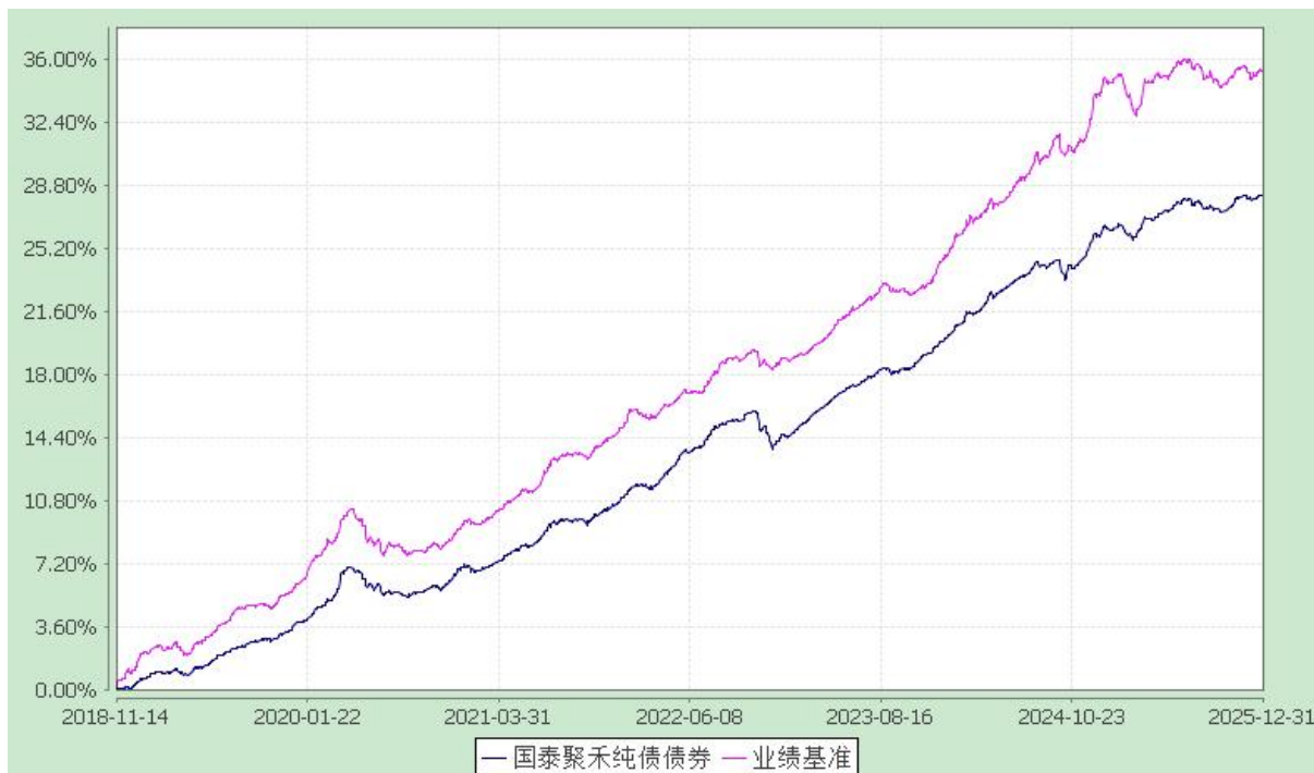
自基金合同生效以来份额累计净值增长率与业绩比较基准收益率的历史走势对比图 (2018 年 11 月 14 日至 2025 年 12 月 31 日)

注：本基金合同生效日为 2018 年 11 月 14 日。本基金在六个月建仓期结束时，各项资产配置比例符合合同约定。