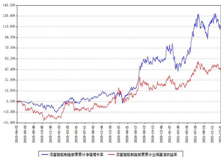
添富智能制造股票累计净值增长率与同期业绩基准收益率对比图

(二) 自基金合同生效以来基金累计净值增长率变动及其与同期业绩比较基准收益率变动的比较图