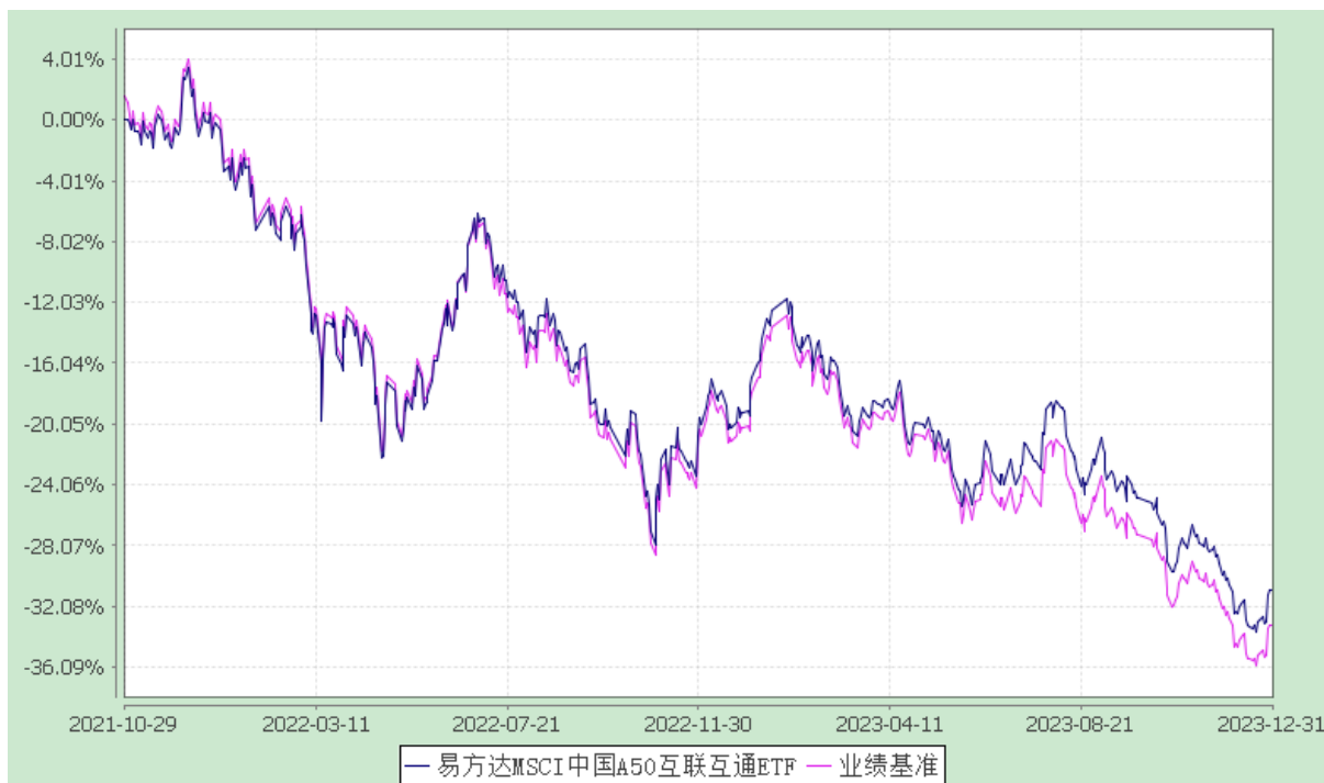
易方达 MSCI 中国 A50 互联互通交易型开放式指数证券投资基金 份额累计净值增长率与业绩比较基准收益率历史走势对比图 (2021 年 10 月 29 日至 2023 年 12 月 31 日)

注：自基金合同生效至报告期末，基金份额净值增长率为-30.99%，同期业绩比较基准收益率为-33.30%。