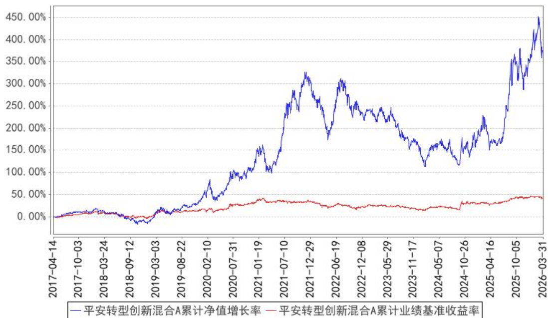
平安转型创新混合A累计净值增长率与同期业绩比较基准收益率的历史走势对比图