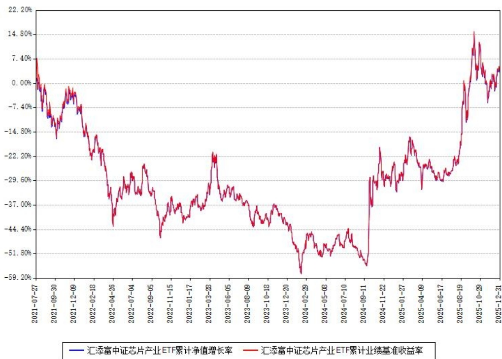
汇添富中证芯片产业ETF累计净值增长率与同期业绩比较基准收益率对比图

注：本基金建仓期为本《基金合同》生效之日（2021年07月27日）起6个月，建仓期结束时各项资产配置比例符合合同约定。