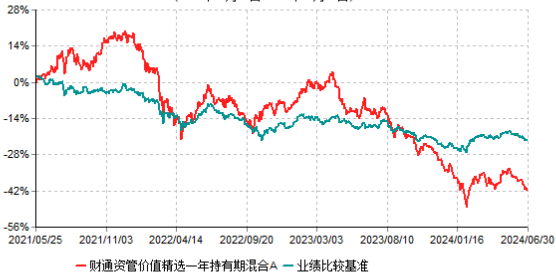
财通资管价值精选一年持有期混合A累计净值增长率与业绩比较基准收益率历史走势对比图 (2021年05月25日-2024年06月30日)