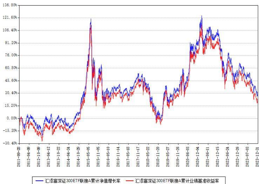
汇添富深证300ETF联接A累计净值增长率与同期业绩基准收益率对比图