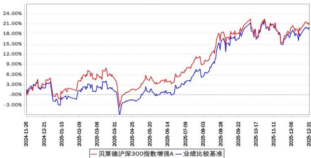
贝莱德沪深300指数增强A累计净值增长率与同期业绩比较基准收益率的历史走势对比图