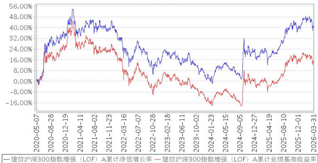
建信沪深300指数增强 (LOF) A 累计净值增长率与同期业绩比较基准收益率的历史走势对比图