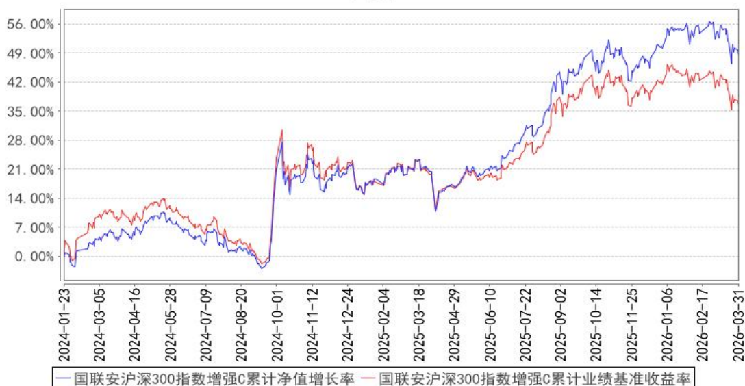
国联安沪深300指数增强C累计净值增长率与同期业绩比较基准收益率的历史走势对比图