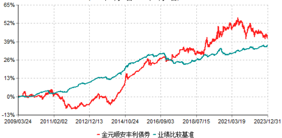
金元顺安丰利债券型证券投资基金累计净值增长率与业绩比较基准收益率历史走势对比图 (2009年03月23日-2023年12月31日)