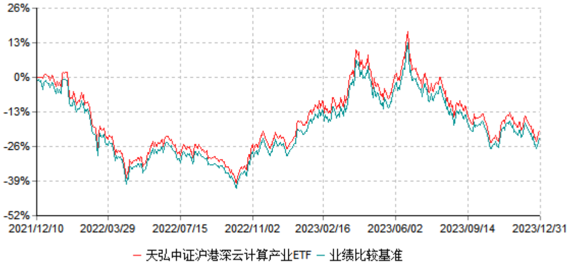
天弘中证沪港深云计算产业交易型开放式指数证券投资基金累计净值增长率与业绩比较基准 收益率历史走势对比图 (2021年12月10日-2023年12月31日)