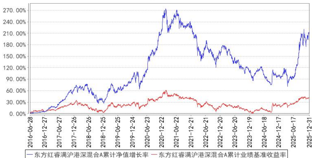
东方红睿满沪港深混合A累计净值增长率与同期业绩比较基准收益率的历史走势对比图