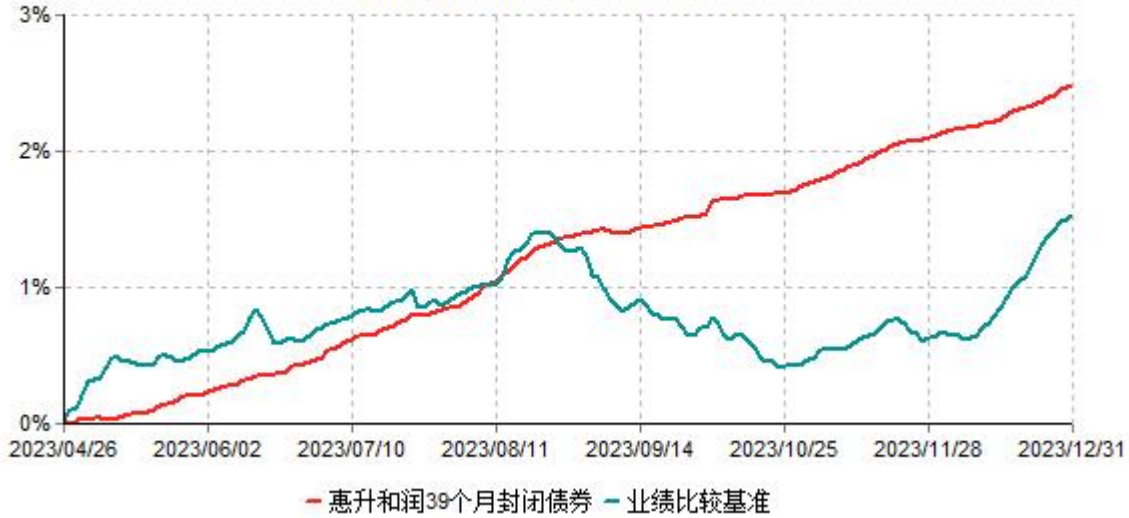
惠升和润39个月封闭式债券型证券投资基金累计净值增长率与业绩比较基准收益率历史走势 对比图 (2023年04月26日-2023年12月31日)