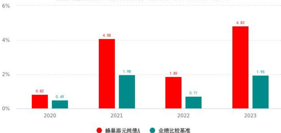
基金的过往业绩不代表未来表现，数据截止日：2023年12月31日