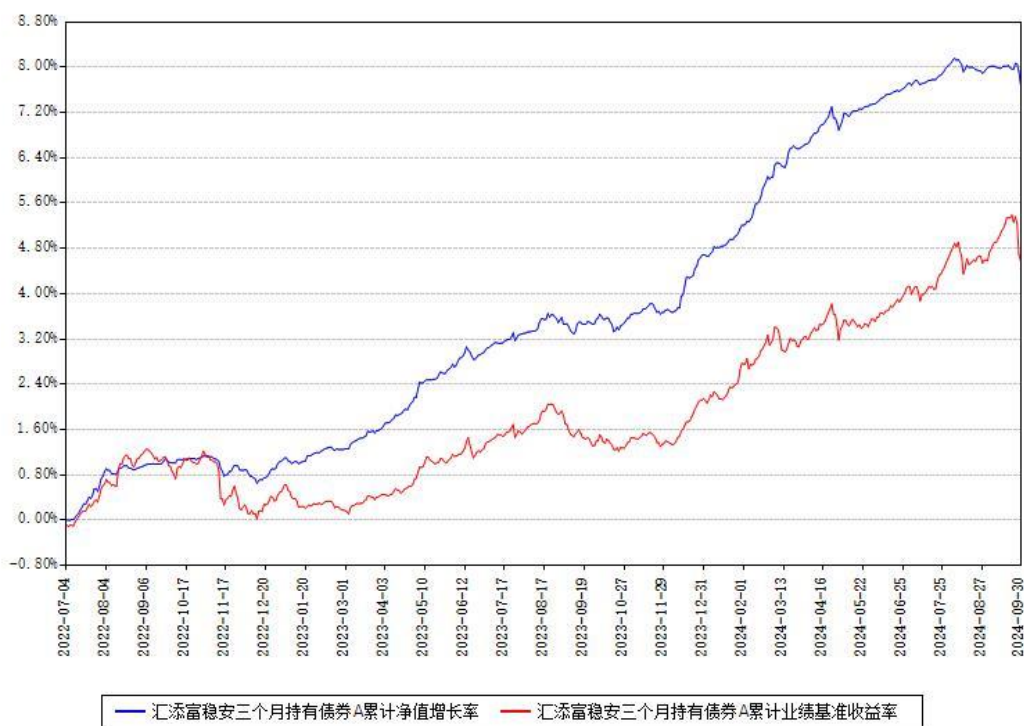
汇添富稳安三个月持有债券A累计净值增长率与同期业绩比较基准收益率对比图