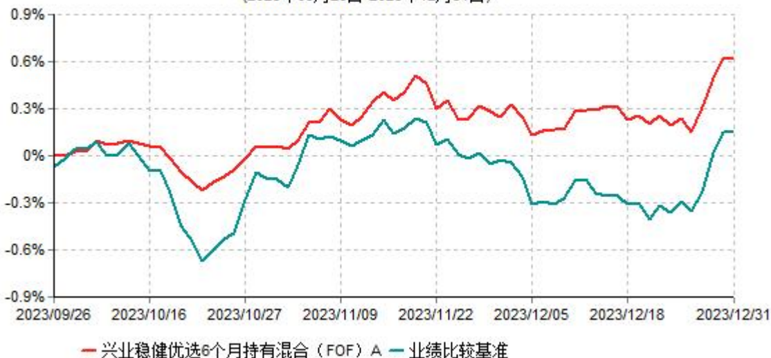
兴业稳健优选6个月持有混合（FOF）A累计净值增长率与业绩比较基准收益率历史走势对比图 (2023年09月26日-2023年12月31日)

注：1、本基金基金合同于2023年9月26日生效，截至报告期末本基金基金合同生效未满一年。