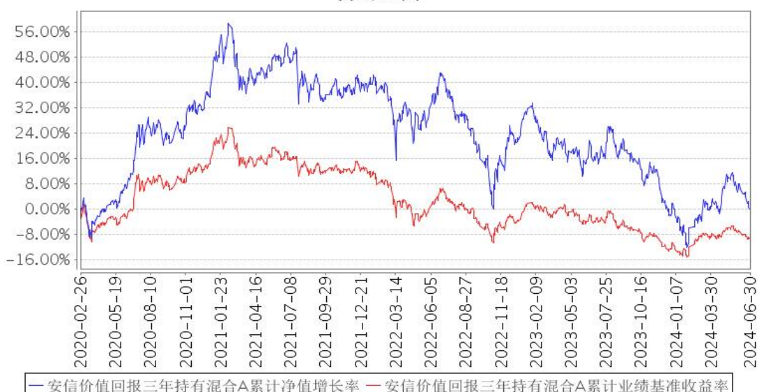
安信价值回报三年持有混合A累计净值增长率与同期业绩比较基准收益率的历史走势对比图