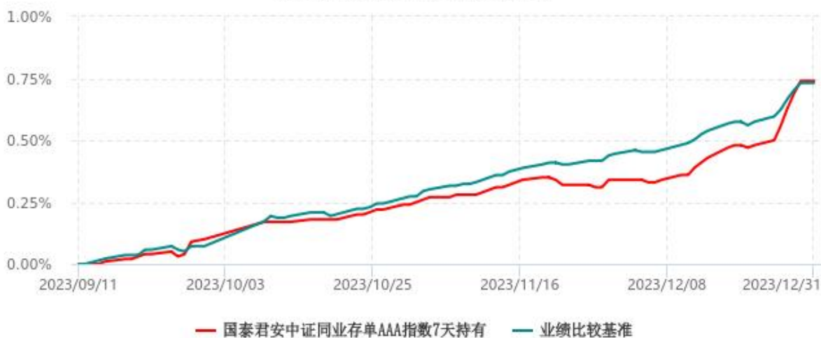
国泰君安中证同业存单AAA指数7天持有期证券投资基金累计净值增长率与业绩比较基准收益率历史走势对比图 (2023年09月11日-2023年12月31日)