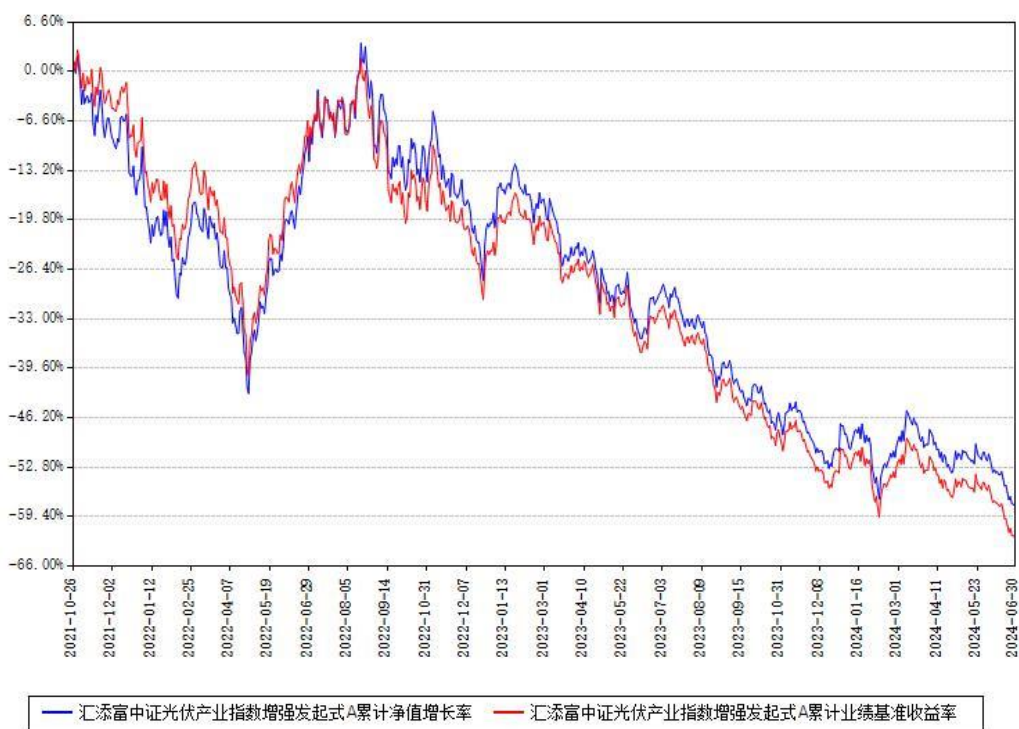
汇添富中证光伏产业指数增强发起式A累计净值增长率与同期业绩基准收益率对比图