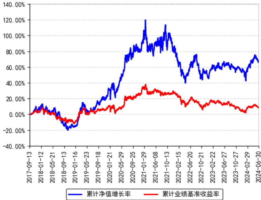
南方兴盛先锋灵活配置混合A累计净值增长率与同期业绩比较基准收益率的历史走势对比图