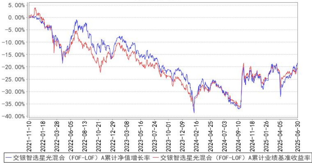
交银智选星光混合（FOF-LOF）A 累计净值增长率与同期业绩比较基准收益率的历史走势对比图