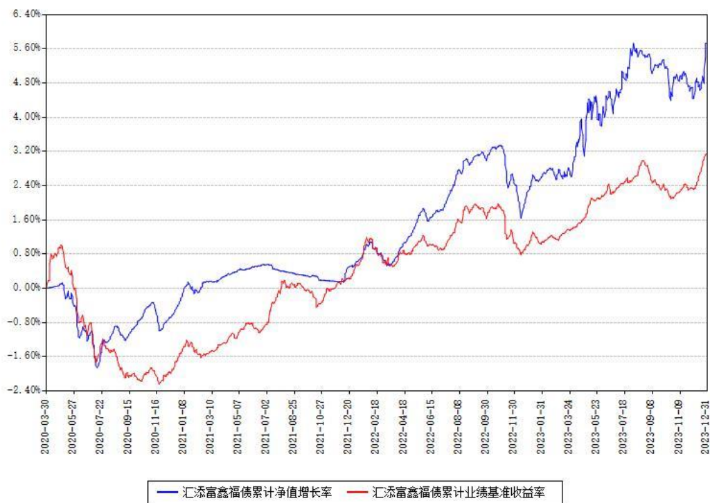
汇添富鑫福债累计净值增长率与同期业绩比较基准收益率对比图

注：本基金建仓期为本《基金合同》生效之日（2020年03月30日）起6个月，建仓期结束时各项资产配置比例符合合同约定。