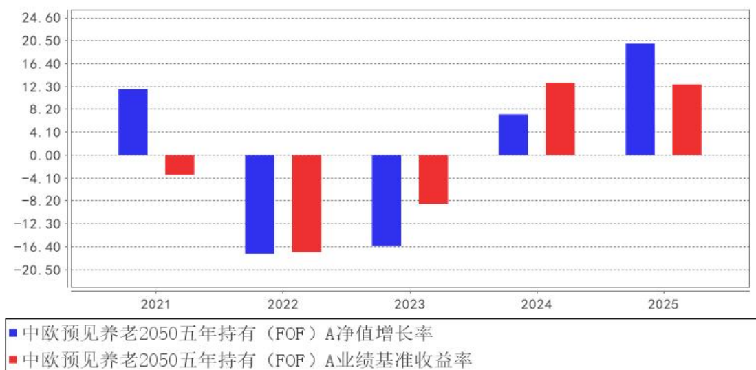
中欧预见养老2050五年持有（FOF）A基金每年净值增长率与同期业绩比较基准收益率的对比图