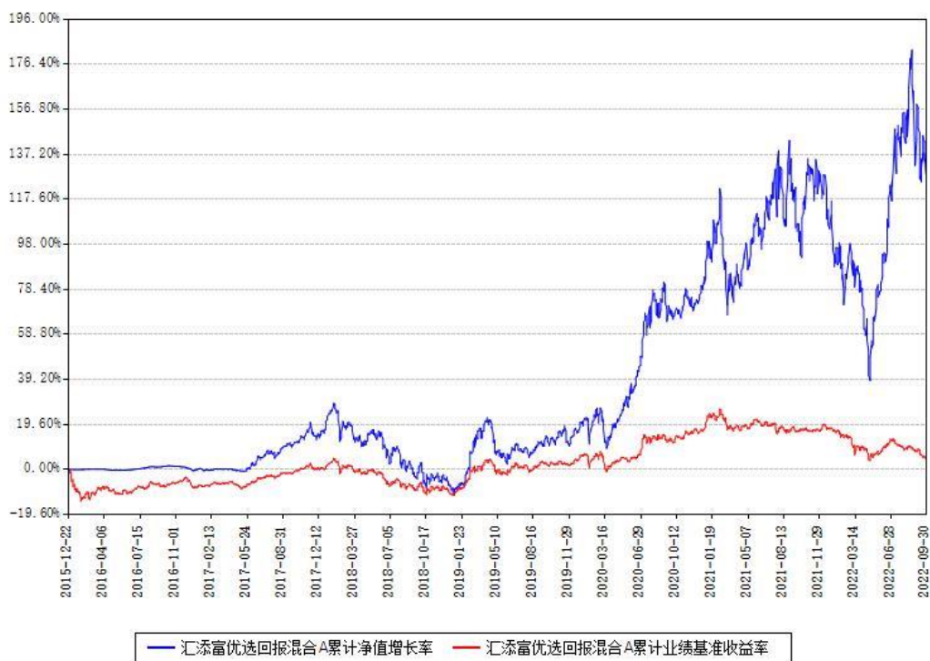
汇添富优选回报混合A累计净值增长率与同期业绩基准收益率对比图