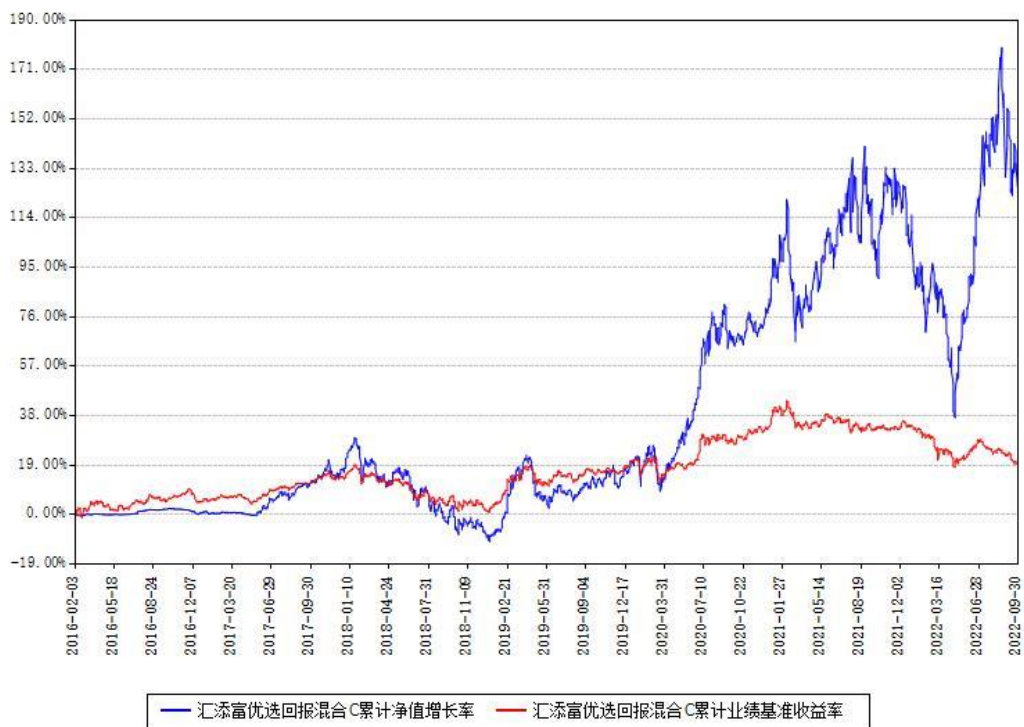
汇添富优选回报混合C累计净值增长率与同期业绩基准收益率对比图