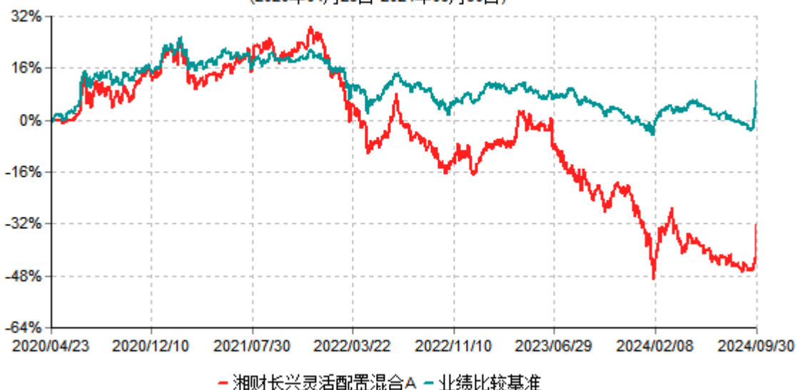
湘财长兴灵活配置混合A累计净值增长率与业绩比较基准收益率历史走势对比图 (2020年04月23日-2024年09月30日)