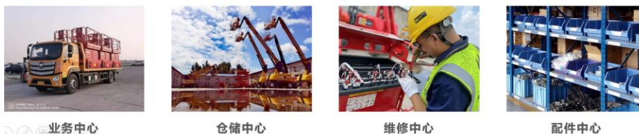
图注：公司线下业务渠道职责

线下渠道主要为全国布局网点，实现业务范围覆盖全国。截至报告期末，公司在境内外共设有 396 个网点。网点不仅提供线下业务渠道，同时也是公司的设备储存场地与售后服务基地。网点数量与密度的增加，能够在提升业务覆盖范围的同时缩短单个网点的辐射半径，提升服务效率。