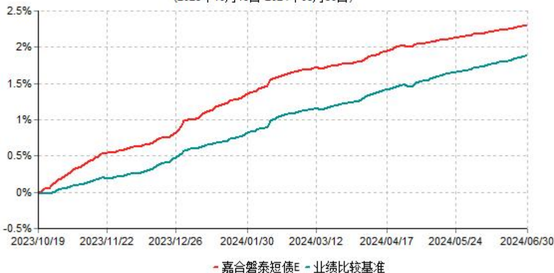
嘉合磐泰短债E累计净值增长率与业绩比较基准收益率历史走势对比图 (2023年10月19日-2024年06月30日)

注：本基金于2023年10月19日增设E类基金份额，E类基金份额实际存续从2023年10月19日开始。