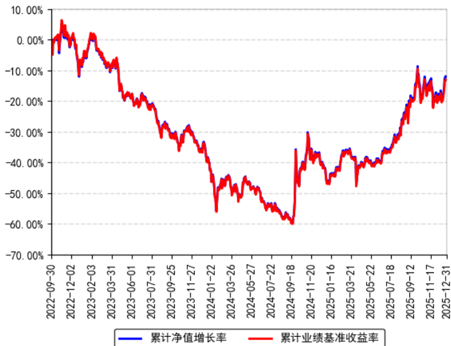
南方上证科创板新材料ETF累计净值增长率与同期业绩比较基准收益率的历史走势对比图