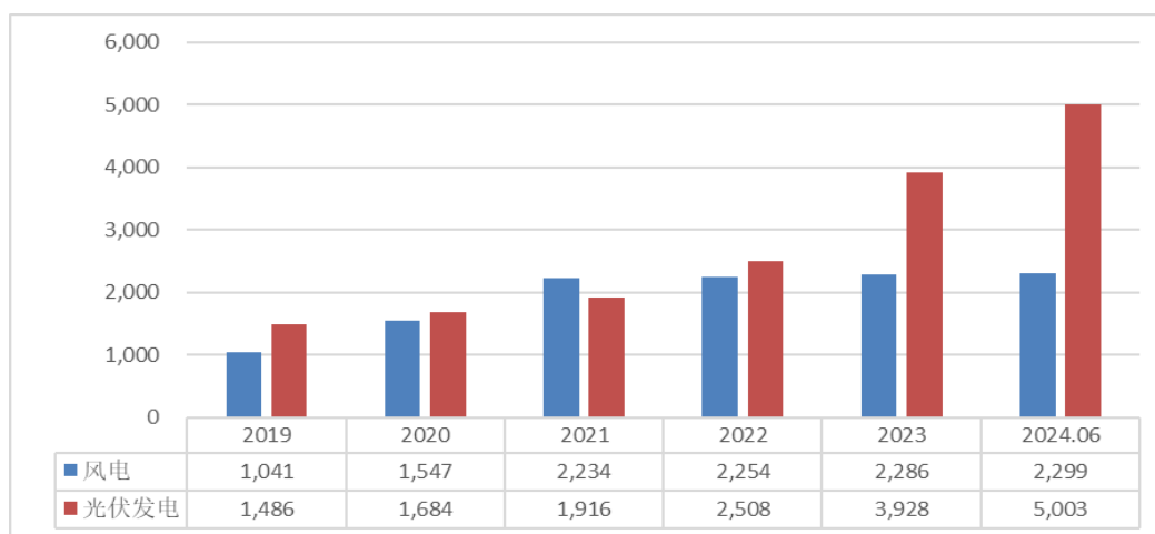
图：近五年江苏省风电、光伏发电累计装机容量（万千瓦）

1-6 月份，全省发电量 3177.92 亿千瓦时，同比增长 8.17%。全省风电和光伏发电量 555.14 亿千瓦时，同比增长 21.36%，占全省发电量的 17.47%，占比同比提高 1.90 个百分点。其中，风电发电量 288.35 亿千瓦时，同比下降 0.90%；光伏发电量 266.79 亿千瓦时，同比增长 60.25%。