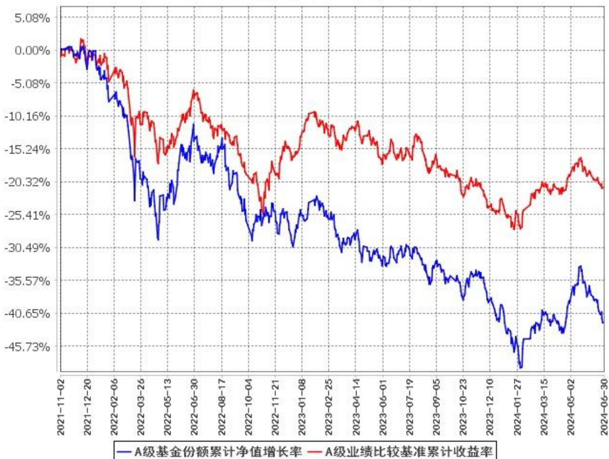
A级基金份额累计净值增长率与同期业绩比较基准收益率的历史走势对比图 (2021年11月2日至2024年6月30日)