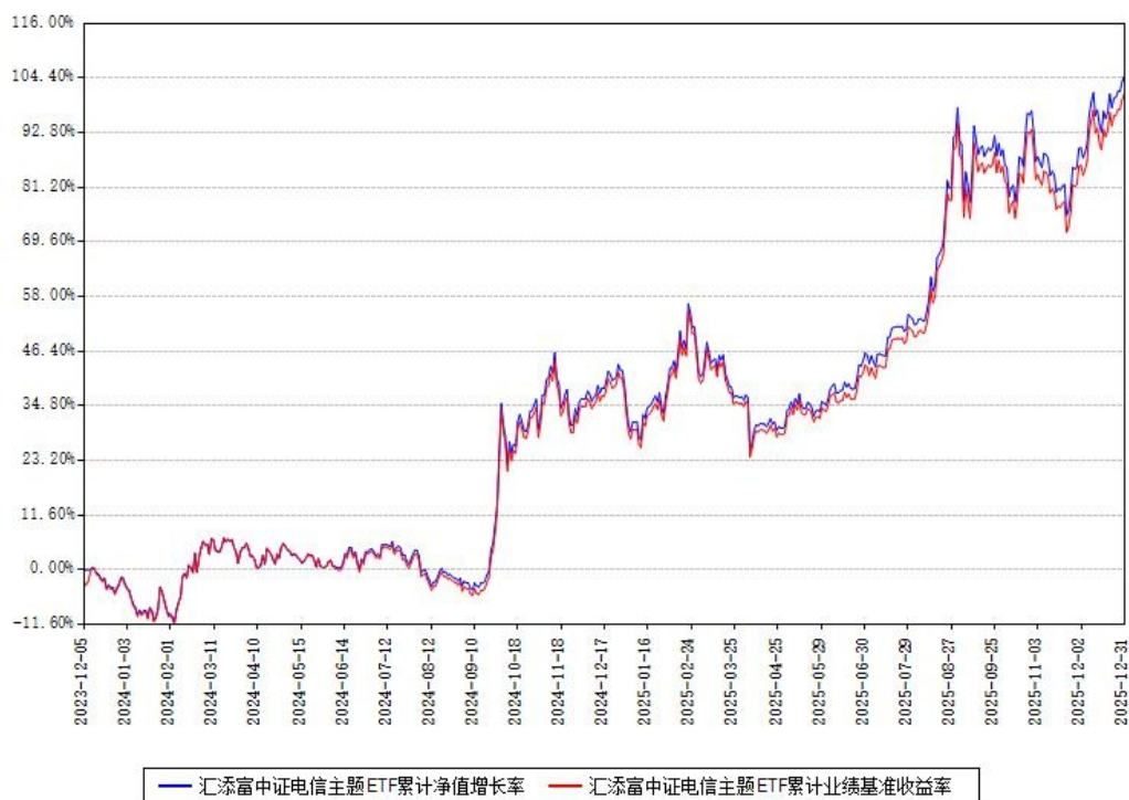
汇添富中证电信主题ETF累计净值增长率与同期业绩基准收益率对比图

注：本基金建仓期为本《基金合同》生效之日（2023年12月05日）起6个月，建仓期结束时各项资产配置比例符合合同约定。