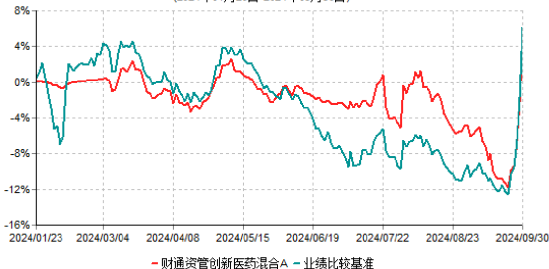
财通资管创新医药混合A累计净值增长率与业绩比较基准收益率历史走势对比图 (2024年01月23日-2024年09月30日)