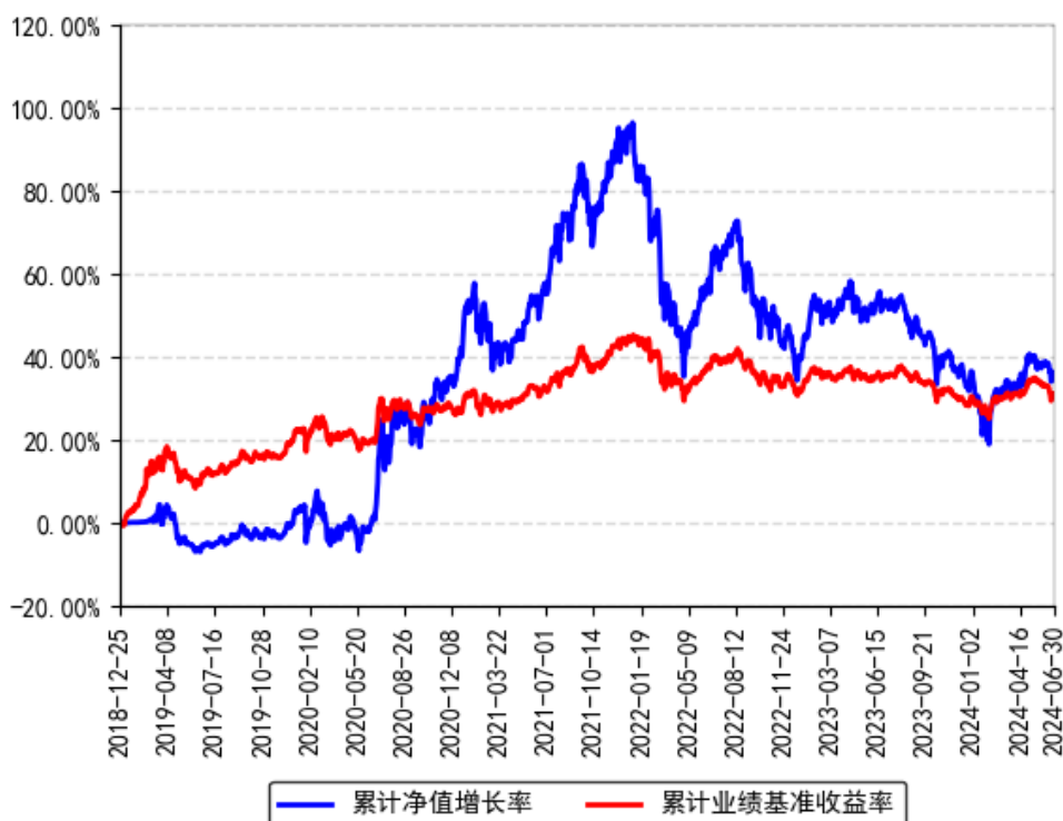
南方昌元可转债债券A累计净值增长率与同期业绩比较基准收益率的历史走势对比图