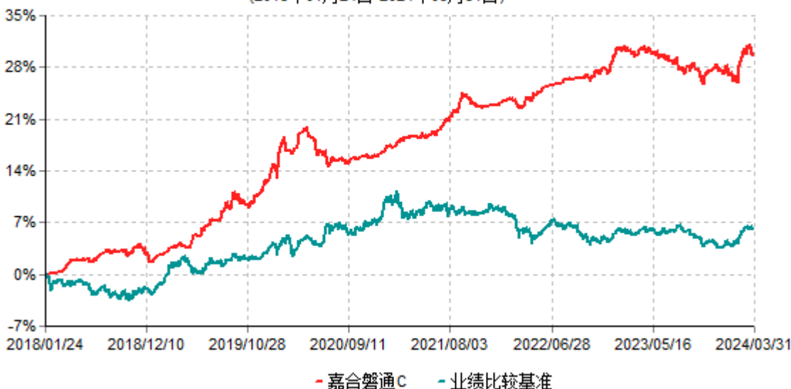
嘉合磐通C累计净值增长率与业绩比较基准收益率历史走势对比图 (2018年01月24日-2024年03月31日)