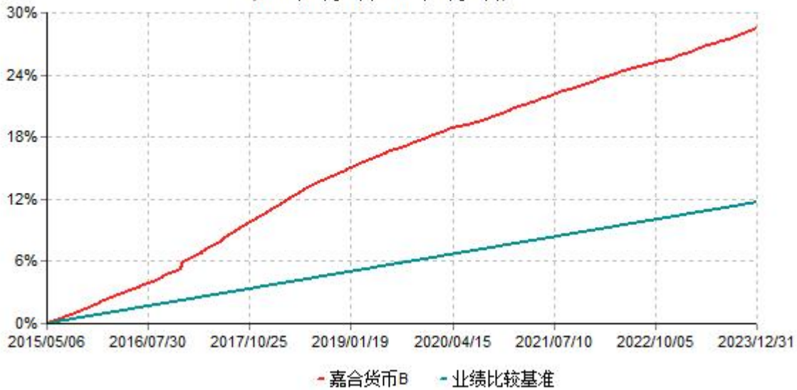
嘉合货币B累计净值收益率与业绩比较基准收益率历史走势对比图 (2015年05月06日-2023年12月31日)