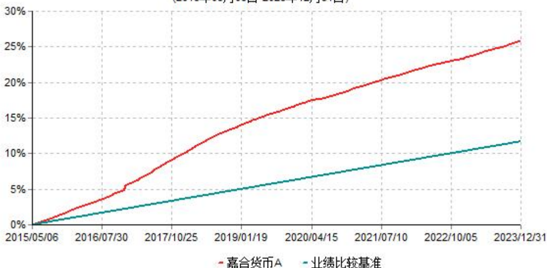
嘉合货币A累计净值收益率与业绩比较基准收益率历史走势对比图 (2015年05月06日-2023年12月31日)