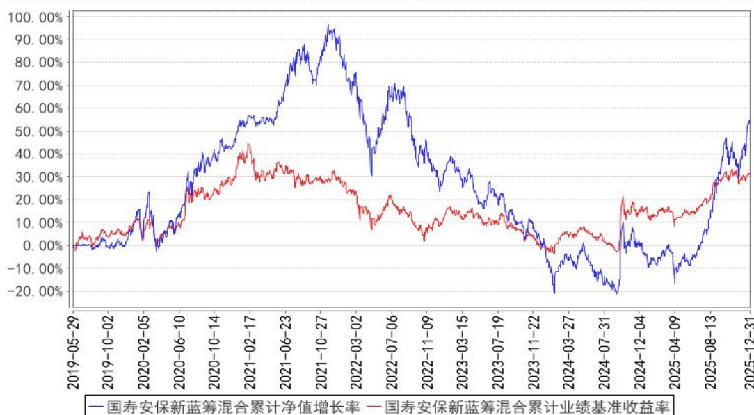
国寿安保新蓝筹混合累计净值增长率与同期业绩比较基准收益率的历史走势对比图

注：本基金基金合同生效日为 2019 年 05 月 29 日，按照本基金的基金合同规定，自基金合同生效之日起 6 个月内使基金的投资组合比例符合基金合同关于投资范围和投资限制的有关约定。本基金建仓期结束时各项资产配置比例符合基金合同约定。图示日期为 2019 年 05 月 29 日至 2025 年 12 月 31 日。