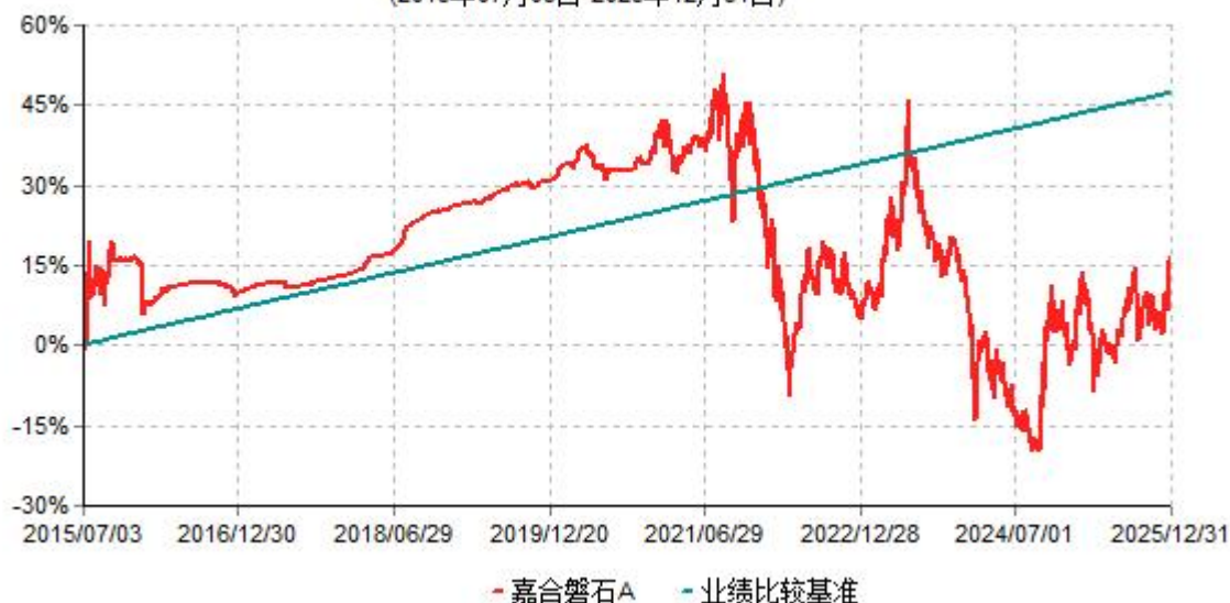
嘉合磐石A累计净值增长率与业绩比较基准收益率历史走势对比图 (2015年07月03日-2025年12月31日)